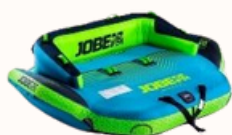
Binar 3 P...