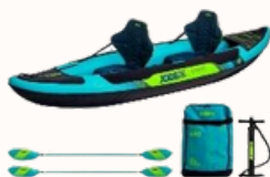
CROFT inflatable Kayak