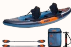
GAMA Inflatable Kayak 1