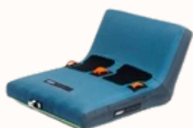
Infinity Switch 2P.